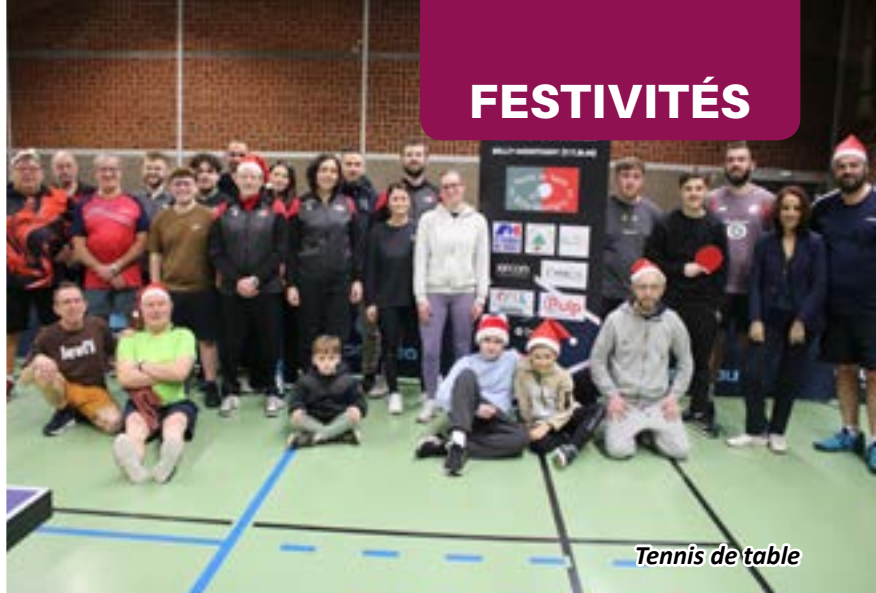
Tennis de table