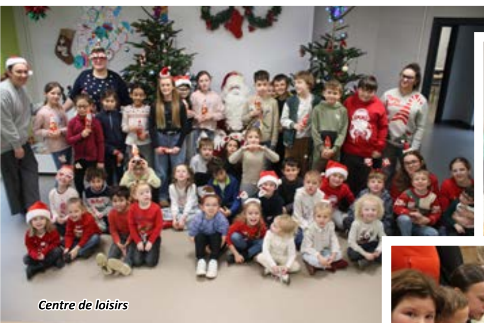
Centre de loisirs