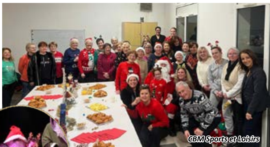
GBM Sports et Loisirs