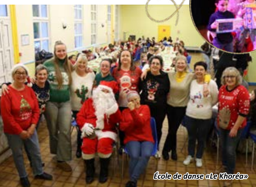
École de danse «Le Khoréa»