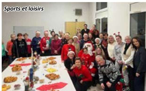
Sports et loisirs