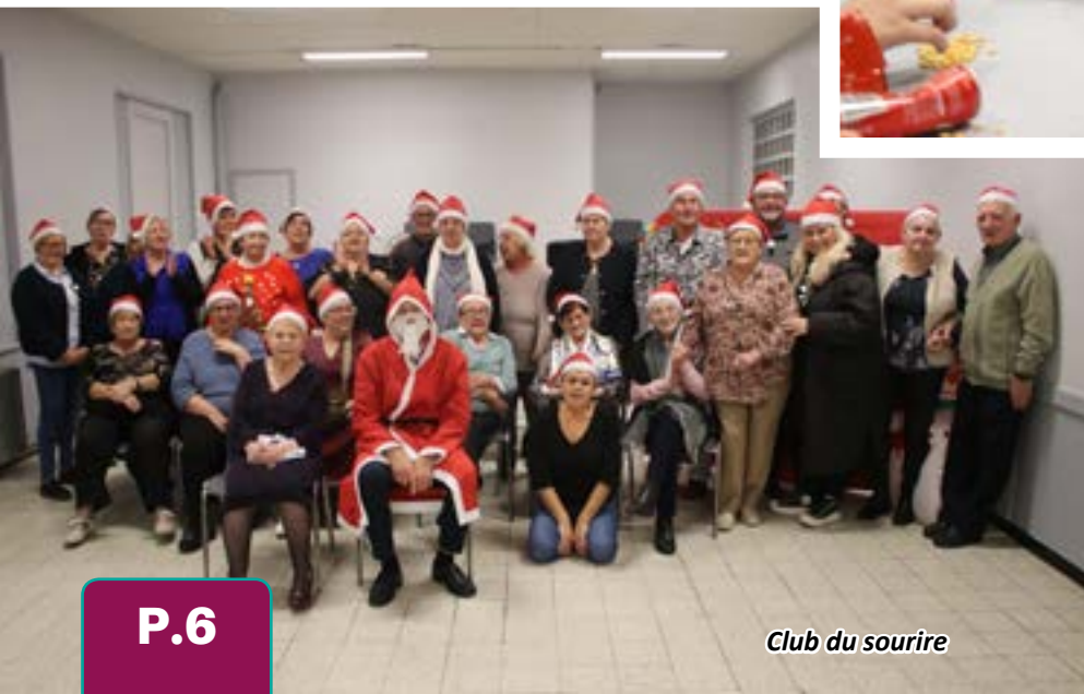
Club du sourire