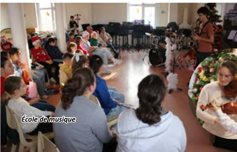
École de musique