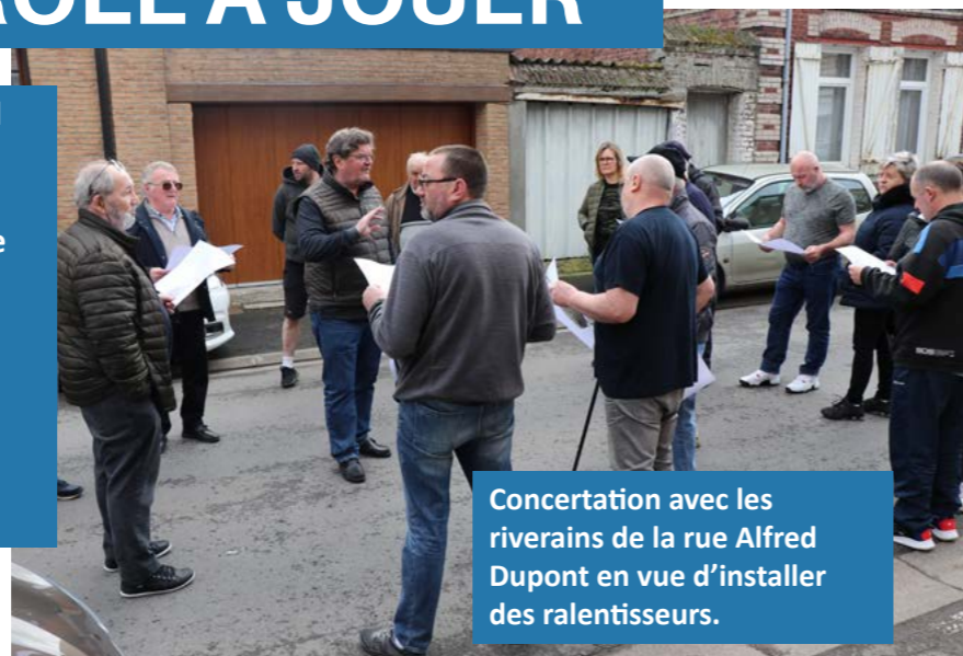
Concertation avec les riverains de la rue Alfred Dupont en vue d'installer des ralentisseurs.

Pour cela, la municipalité utilise plusieurs dispositifs comme les feux tricolores intelligents ou encore les limitations de vitesse selon les zones. Les ASVP ont aussi un rôle pour sécuriser la voirie, notamment devant les écoles. Mais pour réduire physiquement la vitesse, des ralentisseurs sont matérialisés.