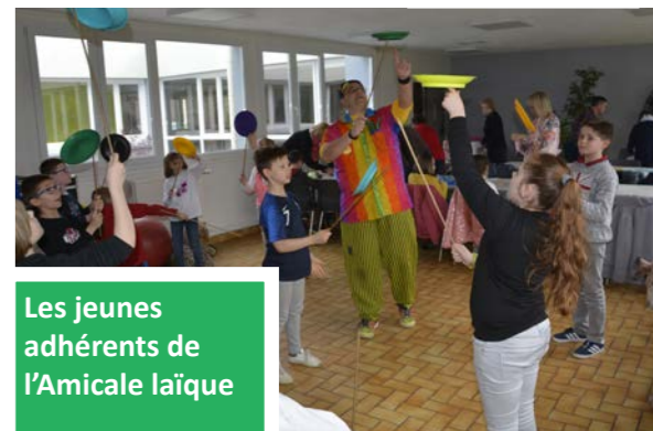
Les jeunes adhérents de l'Amicale laïque