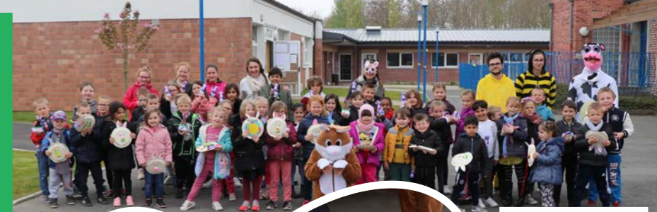
Les enfants du centre de loisirs