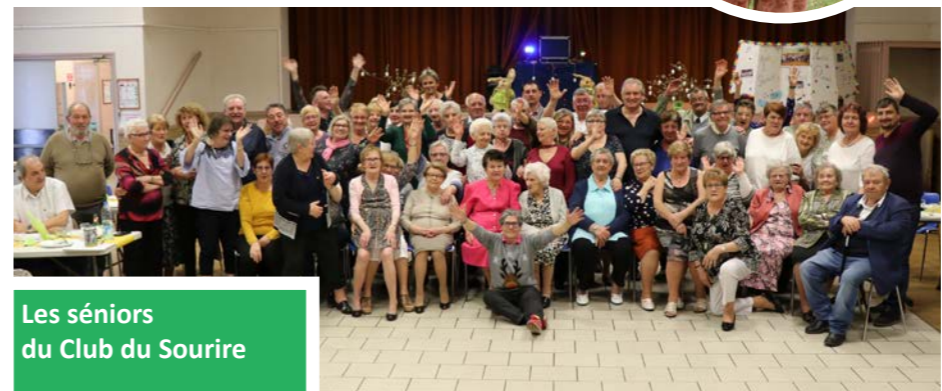
Les séniors du Club du Sourire