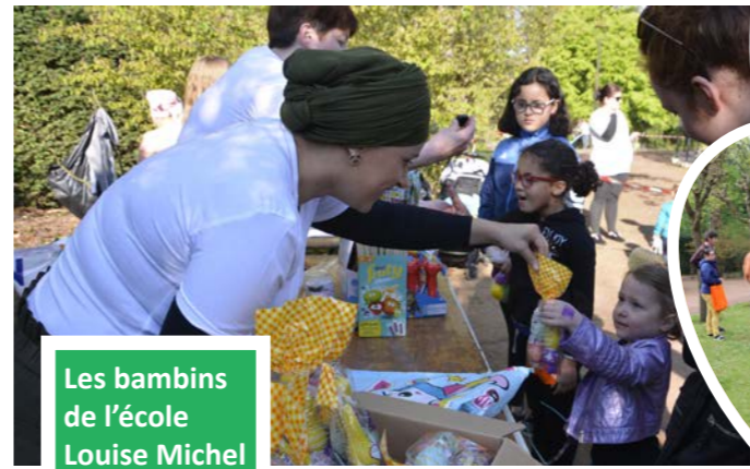
Les bambins de l'école Louise Michel