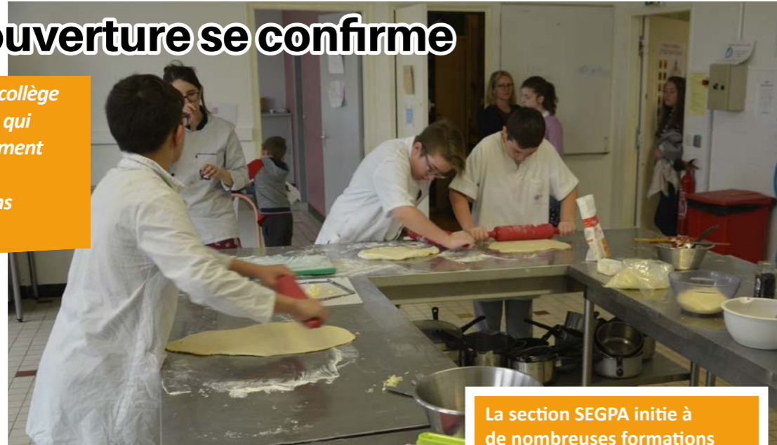
La section SEGPA initiée à de nombreuses formations professionnelles.

L'établissement a, en outre, la particularité de proposer une offre de formation assez large avec les sections sportives et de SEGPA. "Il y a aussi les classes bilingues qui feront l'objet d'échanges chez nos voisins d'outre-Rhin, à Bönen, dès cette année (lire Billy-Infos n°15-mars 2019), et en Espagne à partir de l'an prochain. Le voyage en Angleterre pour les 6 e est, lui, perpétué".